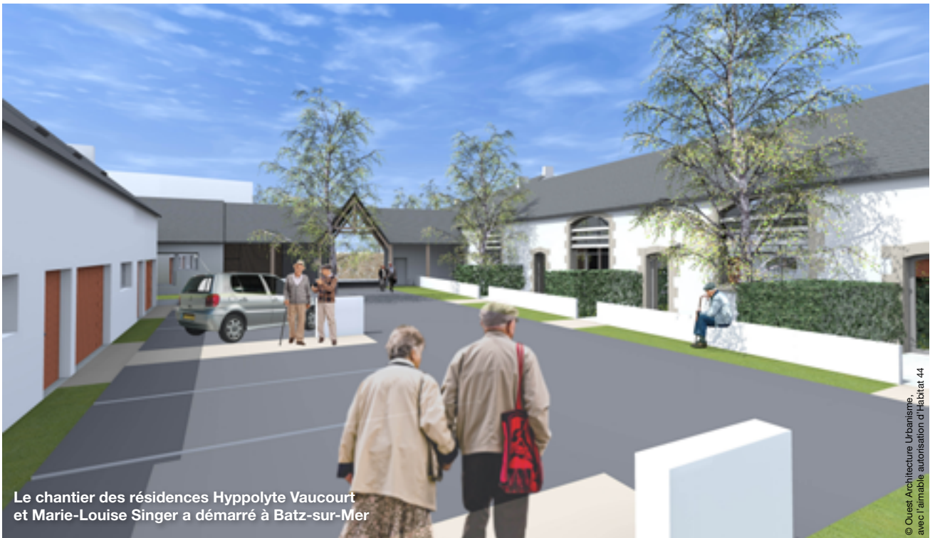
© Ouest Architecture Urbanisme, avec l'aimable autorisation d'Habitat 44