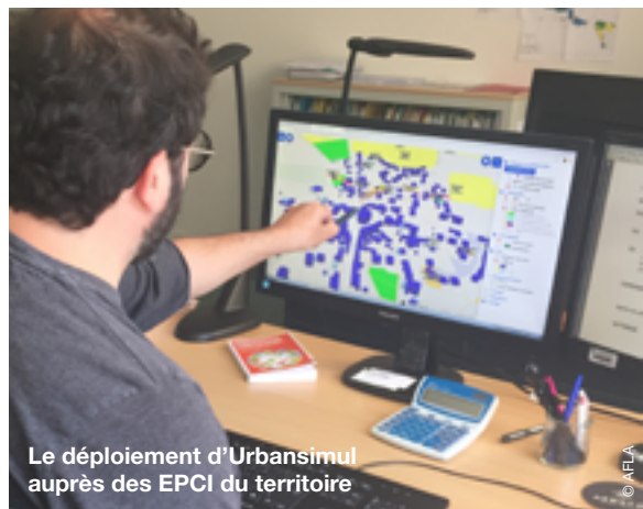
Le déploiement d'Urbansimul auprès des EPCI du territoire

Pour les collectivités locales, son utilisation permet d'établir des stratégies foncières, notamment dans une optique de maîtrise de la consommation de l'espace. Urbansimul permet d'adapter les projets municipaux ou intercommunaux à l'offre foncière, en apportant la connaissance des typologies de sols, de leur occupation actuelle, des zonages définis dans les documents d'urbanisme et des transactions immobilières.