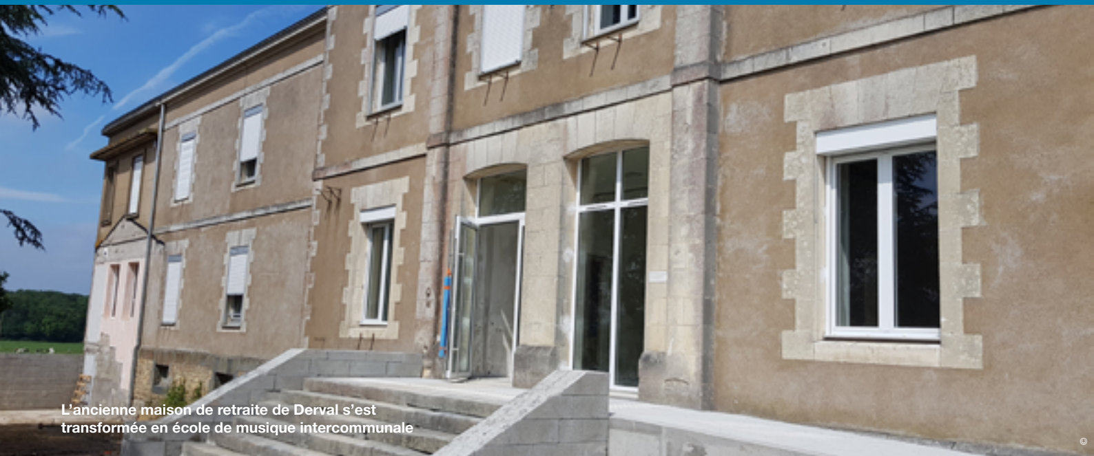
L'ancienne maison de retraite de Derval s'est transformée en école de musique intercommunale